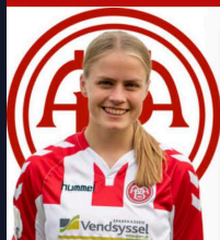
6 GRY BOE THRYSOE