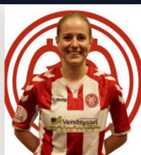
5 LINEA LUNDBO